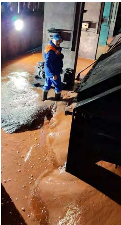
Suterén komplexov zaplavený rudným blatom.

ich mimoriadnemu nasadeniu a častej operatívnej činnosti sa podarilo toto obdobie úspešne zvládnuť. Zároveň sme vďaka posilneniu strojného a personálneho obsadenia na pracovisku Východná rampa Portál zamestnancami, ktorých BTS prijala od 1. 3. 2022 zo ZSSK CARGO, nahradili znížené výkony prekládkových komplexov zvýšeným nasadením rýpadlovej prekládky. Zimnú sezónu z pohľadu požiadaviek na rozmrazovanie substrátov hodnotíme ako priemernú, s celkovým počtom 6 659 rozmrazených ŠR vozňov. Pre