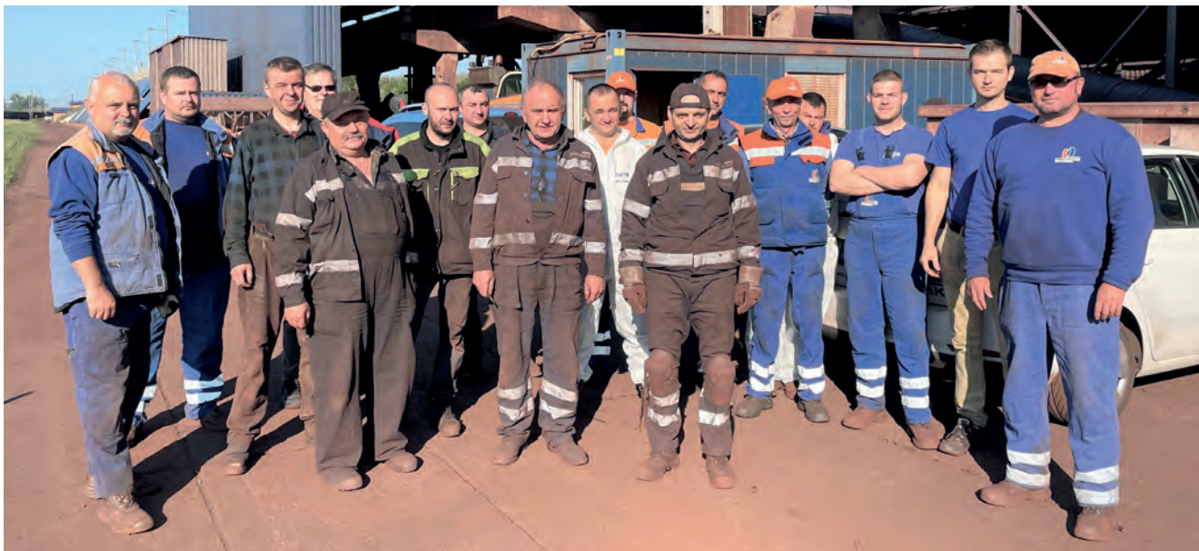
Ranné rozdelenie prác v rámci odstávky Prekládkového komplexu Západ dňa 4. 6. 2021. Na zábere sú zamestnanci BTS a spoločnosti FAMA-K-FAMUR.