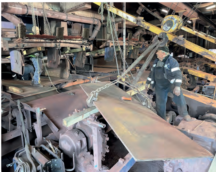
Osadzovanie hardroxových platní na vyhrňovači Z1 v Prekládkovom komplexe Západ. Oprava sa vykonala počas profylaktickej prehliadky zariadení na prelome mája a júna.

V porovnaní s aktuálnym plánom výkonov a poklesom výkonov v minulom roku treba pozitívne hodnotiť postupný nárast výkonov od začiatku roka 2021. Tohtoročný objem prekládky je vyšší ako v predošlých rokoch 2019 a 2020. Priaznivý vývoj je ovplyvnený hlavne rastom produkcie hutníctva v celom regióne. Zatiaľ čo za obdobie prvých šiestich mesiacov 2020 predstavoval objem prekládky železorzudných substrátov na prekládkových komplexoch len 1,865 milióna ton, v tomto roku sa objem opäť navýšil a na konci júna bolo preložených už 2,346 mil. ton substrátov.