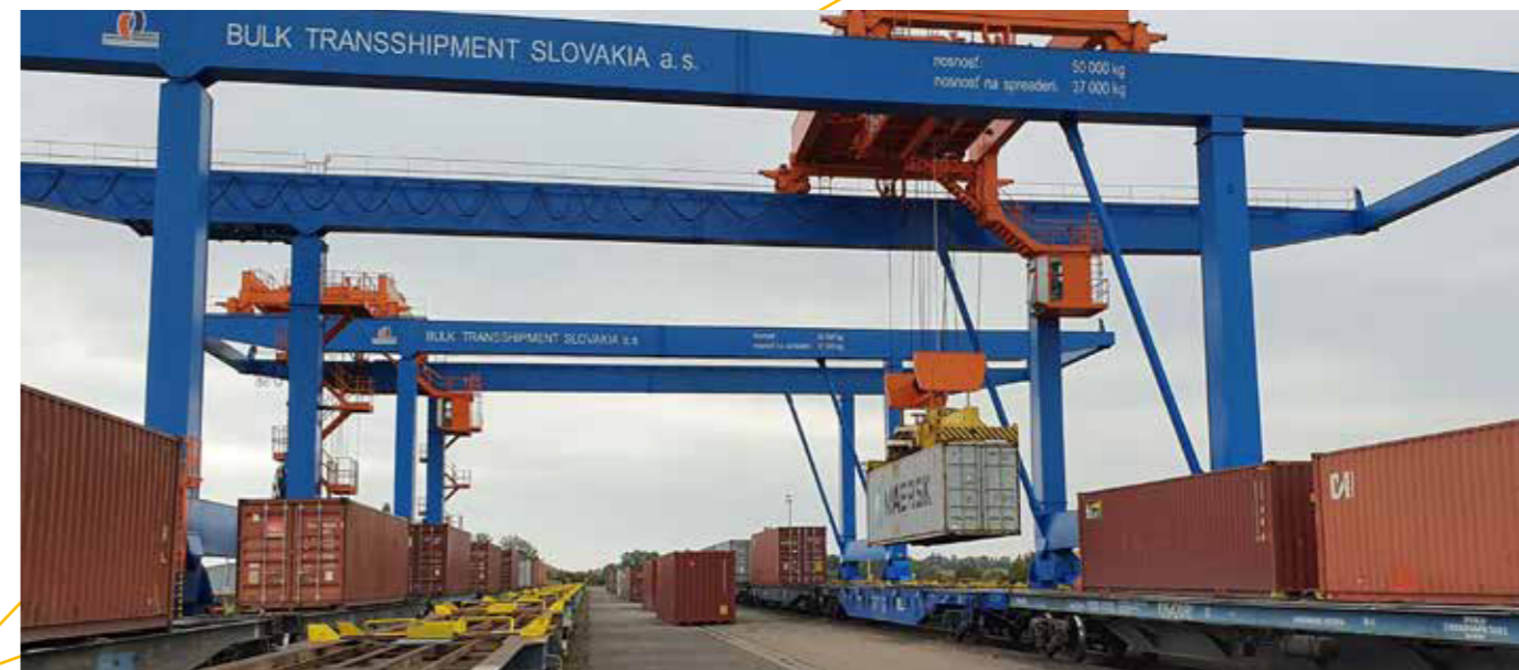
Na najdôležitejšie opravy technologických zariadení - žeriavov, čelného nakladača, ale aj infraštruktúry terminálu vynaložila BTS od začiatku roka 365-tisíc eur. Since the beginning of the year, BTS has spent 365 thousand euros on the most important repairs of technological equipment - the cranes, the front loader, as well as the terminal infrastructure.

The current maximum transshipment capacity of the terminal is 430 TEUs in 24 hours, which represents approximately 3,200 trains per year in continuous operation.