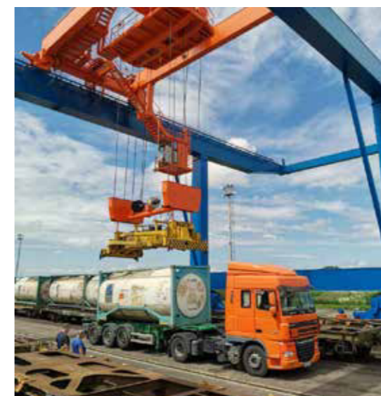
VTKD Dobrá je možné prekladať tovary v kombináciách koľaj - koľaj, koľaj - cestné vozidlo, cestné vozidlo - koľaj a aj cestné vozidlo - cestné vozidlo. Na obrázku je zachytená nakládka kamiónu.

CTT Dobrá can transship goods in the combinations track - track, track - road vehicle, road vehicle - track and also road vehicle - road vehicle. The picture shows the loading of the truck.